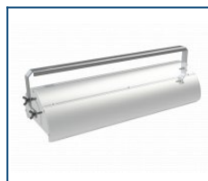
Кронштейн лира Angar 120 (комплект)